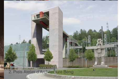
2. Preis Atelier d'Architecture Beng