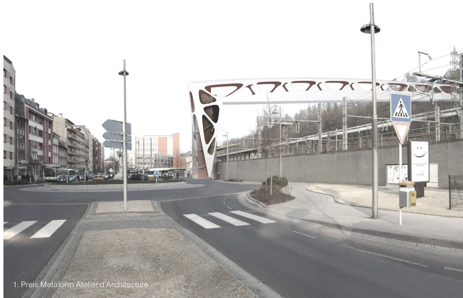
1. Preis Metaform Atelier d'Architecture