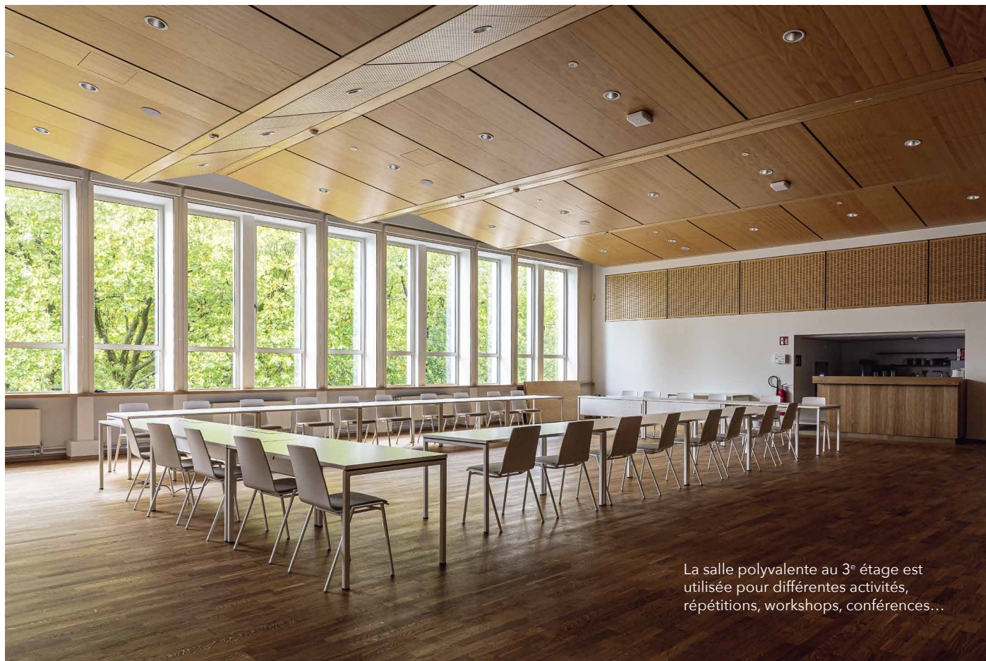
La salle polyvalente au 3 e étage est utilisée pour différentes activités, répétitions, workshops, conférences...

L'idée de tout restaurer à l'identique est souvent frustrante et parfois même irréalisable techniquement : dans le cas de l'Ariston, par exemple, le garde-corps original de l'escalier ne faisait que 60 cm, une mesure qui aujourd'hui n'est plus possible au regard des normes de sécurité qui exigent au minimum 1,10 m. Nous avons donc opté pour ajouter un élément neuf au-dessus de la balustrade ancienne. La chance de ce bâtiment est que sa deuxième vie est similaire à la première, sa vocation reste d'être lieu de représentation, et sa configuration intérieure a largement été sauvegardée.