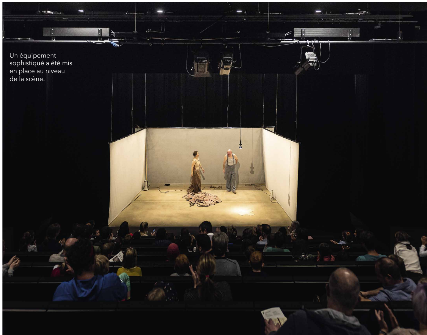
Un équipement sophistiqué a été mis en place au niveau de la scène.

éléments peuvent aussi être enlevés en cas de besoin, pour faire de la place par exemple pour des lectures ou des concerts.